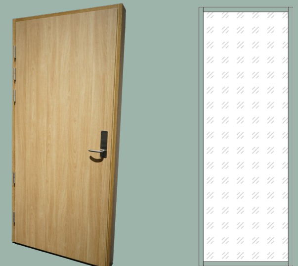
Dør: B30/Rw 50dB

Som sidefelt til dør med tilsvarende lydreduktionsværdi anbefales det, at feltet kun monteres ved karmens låseside. Undgå montering ved karmens hængselside, for at sikre optimal funktion af døren. Vægt incl. karm ca 55kg/m 2 .